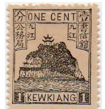
Rocher « Petit Orphan »