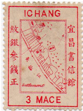
Plan des concessions