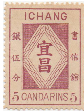
Ichang en caractères modernes chinois

19 timbres dont 5 avec surcharges ont été émis par la poste locale d'Ichang; tous imprimés en lithographie par Tsukiji Type Foundry Co. Tokyo