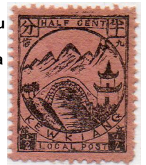
Collines Lu Shan et pont sur la rivière Lung K'ai Ho