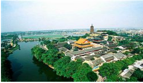
Photo représentant « la Colline Dorée »; site repris sur les timbres