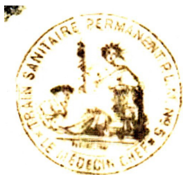
permanent PLM n° 5

Les Trains Sanitaires sont nommés en fonction de leur provenance : PLM, Midi, Nord ; PO ou Etat. Il existait 3 types : les «permanents» au nombre de 5 puis 6 constitués de wagons de luxe, les «semi-permanents» créés à partir du 1er octobre 1914 et formés de voitures voyageurs à intercirculation pour couchés et assis (il y en eu 142) et les «improvisés» composés de wagons de marchandises ou de bestiaux dont le plancher est revêtu de pailles (40).