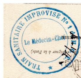
Improvisé n° 1 du HOE 4