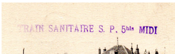
semi-permanent Midi n° 5 bis