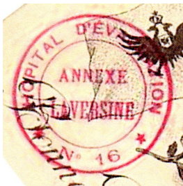
HOE n° 16 – Laversines (près Beauvais)