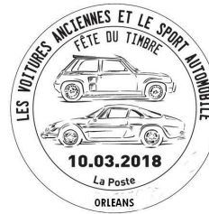
Timbre à Date